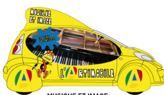
MUSIQUE ET IMAGE