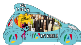
MODE ET BEAUTÉ